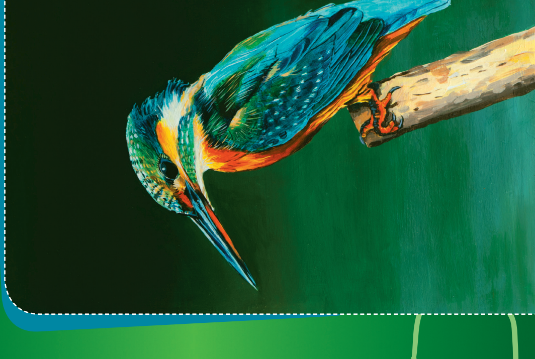
Ledňáček říční Alcedo atthis