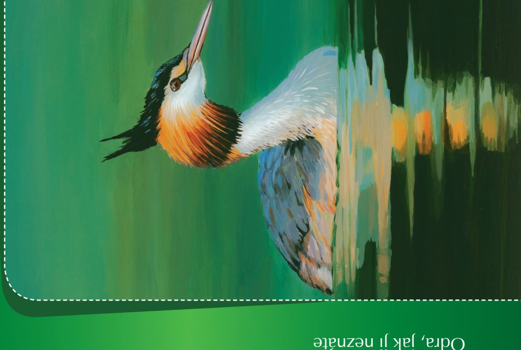
Potápka roháč Podiceps cristatus