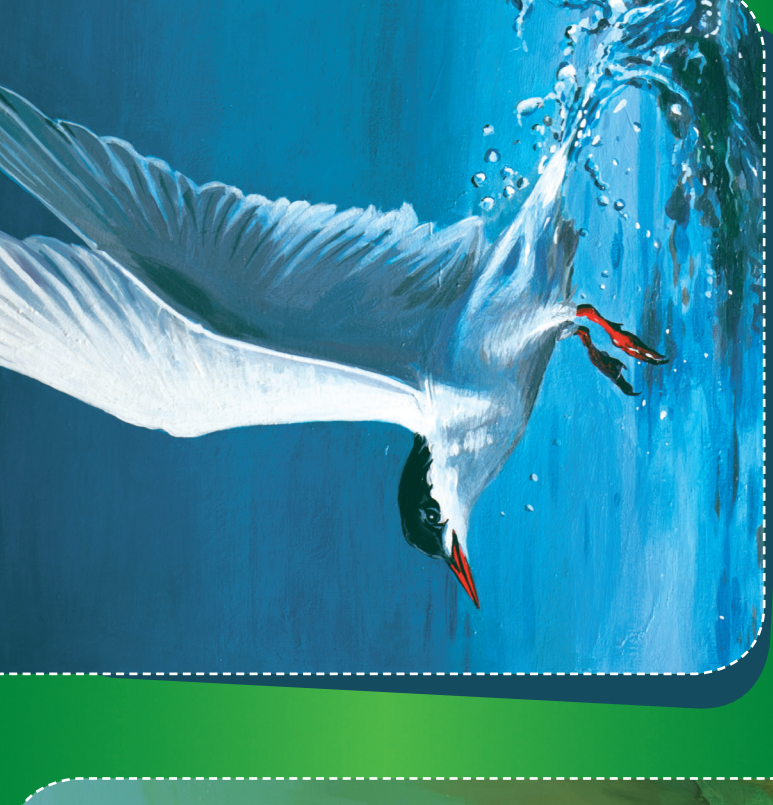
Rybák obecný Sterna hirundo