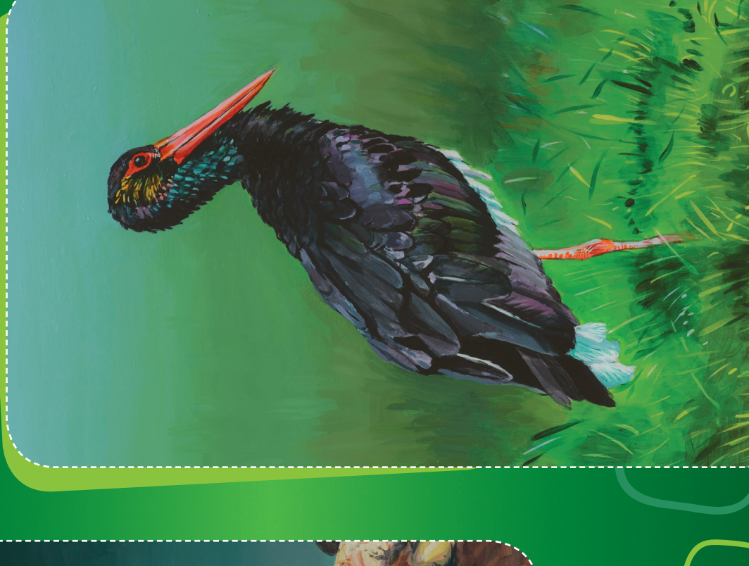
Čáp černý Ciconia nigra