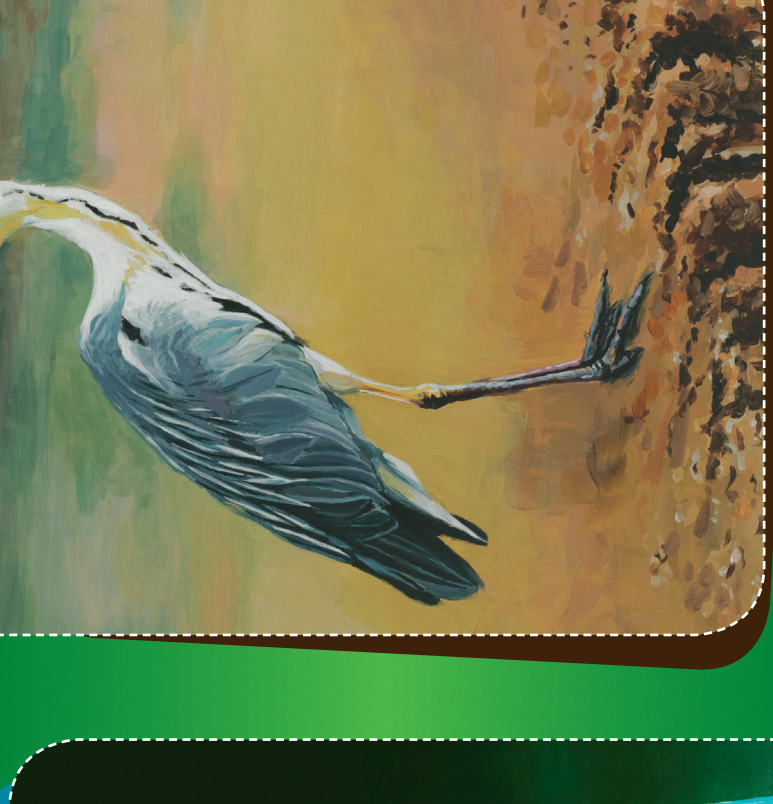
Volavka popelavá Ardea cinerea