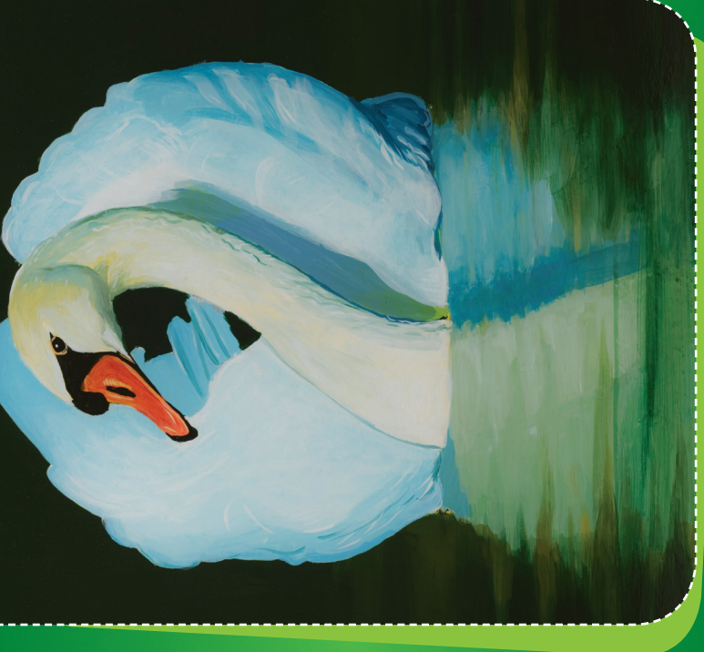
Labuť velká Cygnus olor