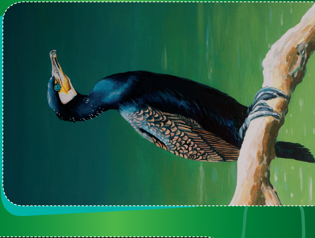
Kormorán velký Phalacrocorax carbo